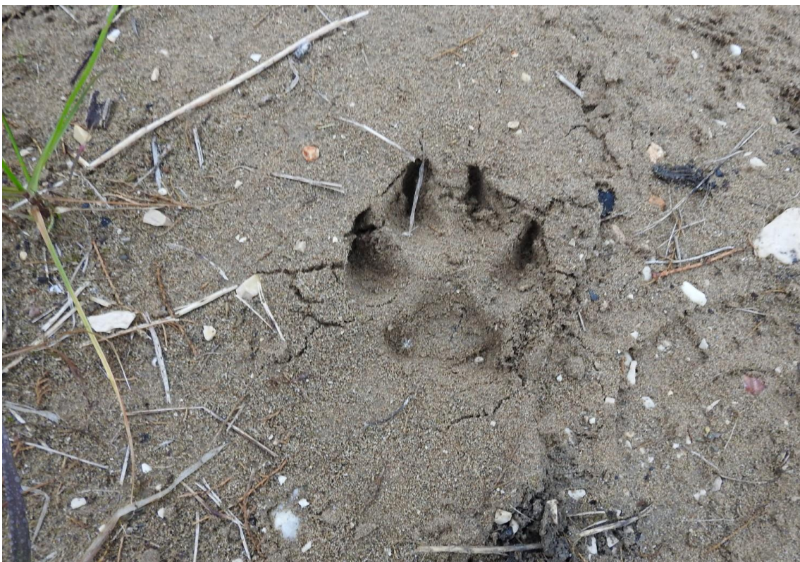
Fotografija 10. Tragovi psa lutalice na donjoj taložnici