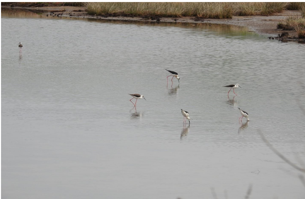
Fotografija 17. Dio lagune Galičak - vlastelice na hranjenju