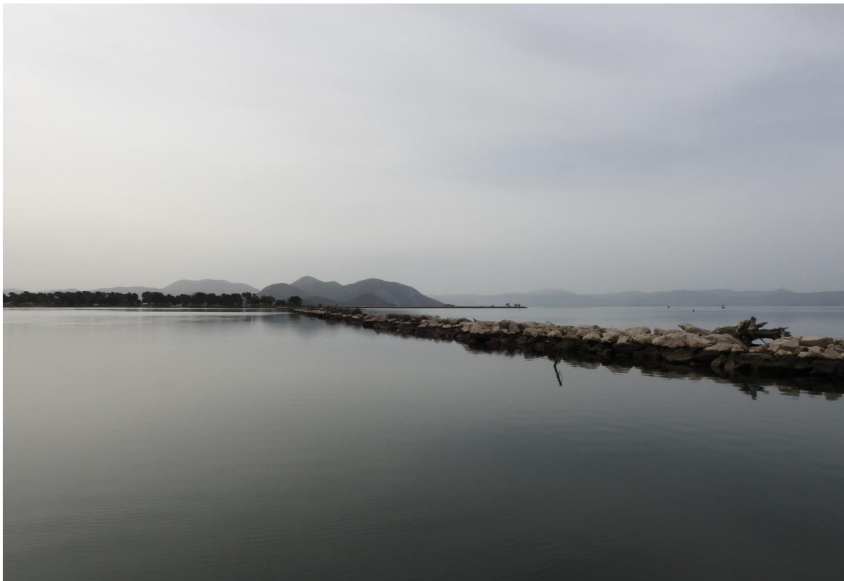
Fotografija 16. Pogled na ušće iz Parila tijekom zimskog monitoringa

Analizom rezultata monitoringa provedenih tijekom deset godina uzastopnih zimskih prebrojavanja, očito je da radovi u luci Ploče nisu imali negativnog utjecaja na zimujuću ornitofaunu jezera Parila i rijeke Lisne. Uobičajene prirodne fluktuacije brojnosti pojedinih vrsta ptica u okvirima su očekivanih rezultata monitoringa. Štoviše, neke vrste znatno su brojnije nego dosadašnjih godina što svakako ide u prilog činjenici kako radovi u luci ne utječu na brojnost zimujućih populacija ovog područja. Na brojnost navedenih zimujućih populacija ptica prevladavajuću ulogu imaju biotski i abiotski čimbenici u staništu koji tijekom nekih zima (ovisno o jačini zima) mogu uzrokovati stradavanja zimovalica u većim ili manjim razmjerima. Nasuprot tome, blage zime omogućavaju veću dostupnost hrane, a samim time i veću uspješnost prezimljavanja. Važno je napomenuti kako su tijekom zimovanja ptice vrlo mobilne te njihova brojnost znatno varira čak i unutar jednog dana osobito ako se monitoring provodi na manjem području kao što je ovdje slučaj.