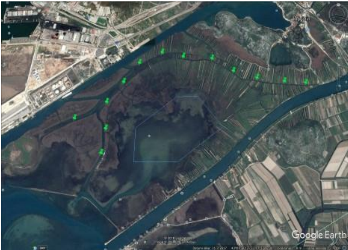
Fotografija 5. Smještaj postaja uz rijeku Lisnu u Parilama (točke postaja od 1 do 13)

Na području jezera Parila koristili smo metodu točkastog prebrojavanja (point – count method). Obrađeno je istih 13 postaja kao i tijekom dosadašnjih godina. Postaje su međusobno udaljene oko 400 m i poredane duž transekta duljine približno 5 km, duž rijeke Lisne (fotografija 5). Postaje su obilježene čamcem. Pri svakom obilasku, obavljeni su po jedan dnevni i jedan noćni transekt (za štijoke i kokošice). Prilikom noćnog transekta, korištena je tehnika zvukovnog vaba (The Call Play Back Method) za izazivanje teritorijalnog glasanja skrovitih triju vrsta štijoka (riđa, siva i mala štijoka) i kokošica. Na svakoj postaji ptice su evidentirane tijekom 10 minuta, a za to vrijeme je motor čamca obavezno ugašen.