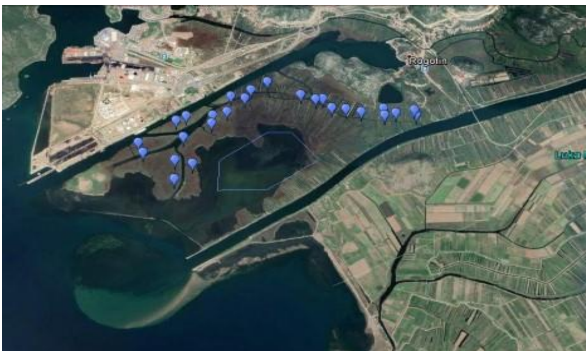
Fotografija 15. Točke mogućih gnijezda kokošice uz rijeku Lisnu