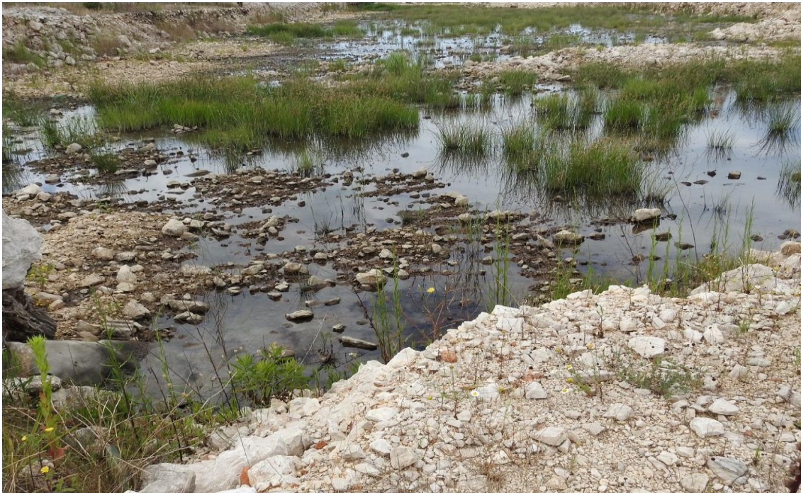
Fotografija 9. Depresija u luci Ploče - mjesto gniježđenja i hranjenja vlastelica