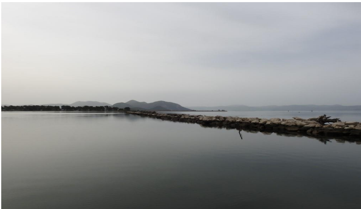
Fotografija 14. Parila laguna dio je monitoringa

Metodom prebrojavanja u točki uz korištenje zvukovnog vaba, na 13 točaka uz rijeku Lisnu (fotografija 2.) od 2007. do 2020. utvrđene su brojnosti ptica močvarica lokalne gnijezdeće populacije koje su prikazane u tablici 3 . Radi se o relativnim brojnostima parova ptica prebrojanih s 13 točaka u močvarnim staništima jezera Parila uz rijeku Lisnu.