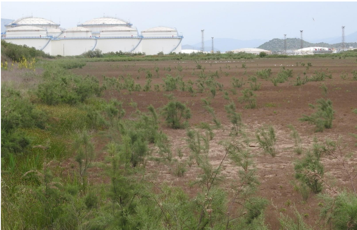
Fotografija 2. Donja taložnica u luci Ploče – u fazi zarastanja i bez vode