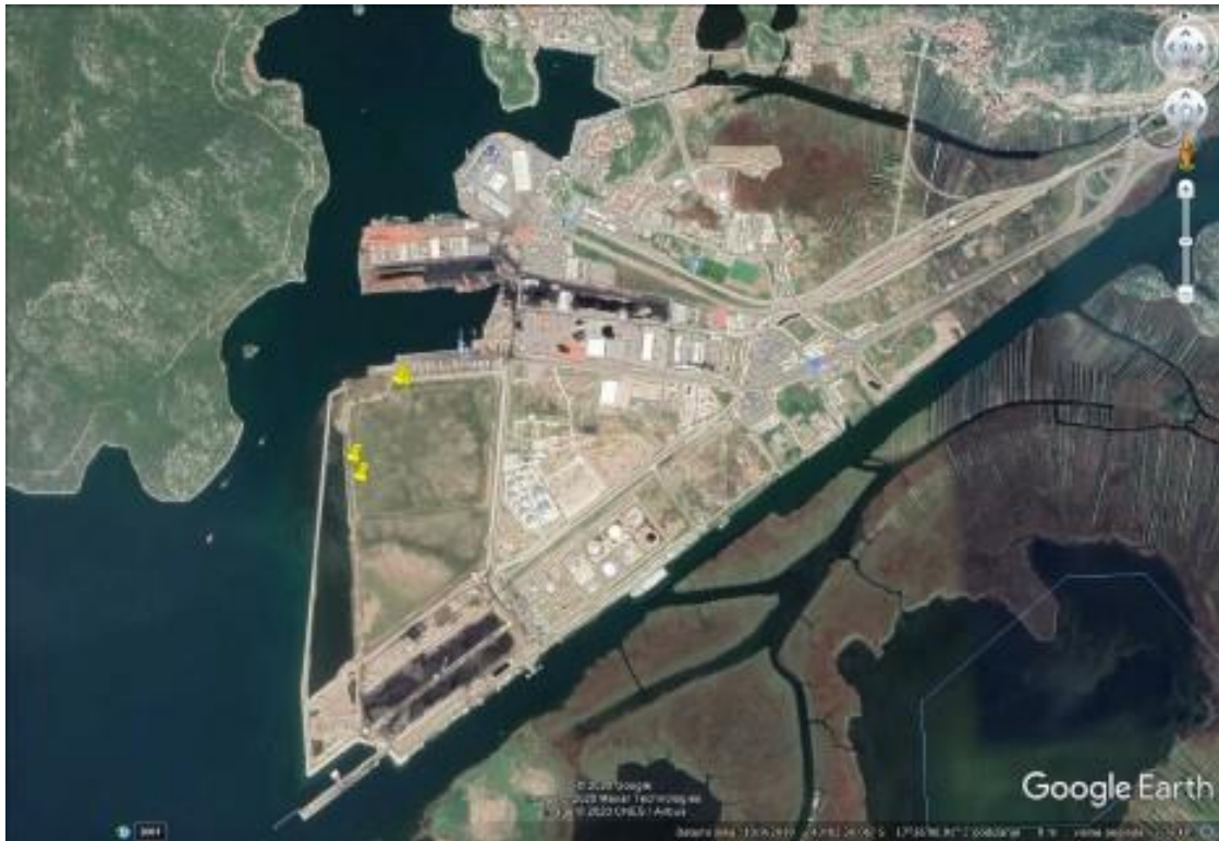
Na fotografiji 11. pomoću Google Earth-a prikazana je brojnost gnijezda vlastelice u luci Ploče