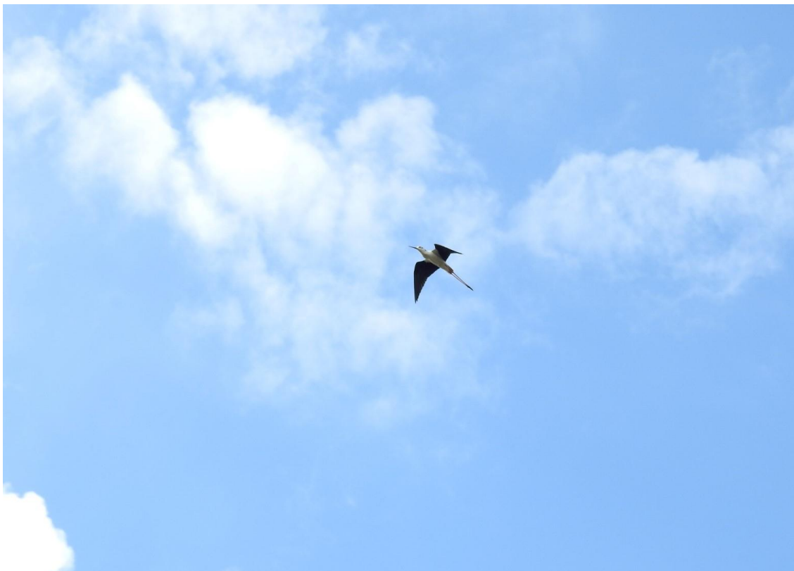
Fotografija 8. Vlastelica nadlijeće mjesto gniježđenja i hranjenja

Tijekom provođenja monitoringa opažene su i mnoge druge vrste ptica, kako na gniježđenju (gnijezdilo je nekoliko parova primorske trepteljke, a tu je i sigurna populacija između 60 i 70 parova pčelarica) tako i na seobi, ali s obzirom na njihov status zaštite one nisu predmet analize u ovoj studiji. Također, izvan područja terminala, odnosno luke redovito su obilažena i ostala područja na kojima se redovito provodilo prebrojavanje vlastelice i morskog kulika.