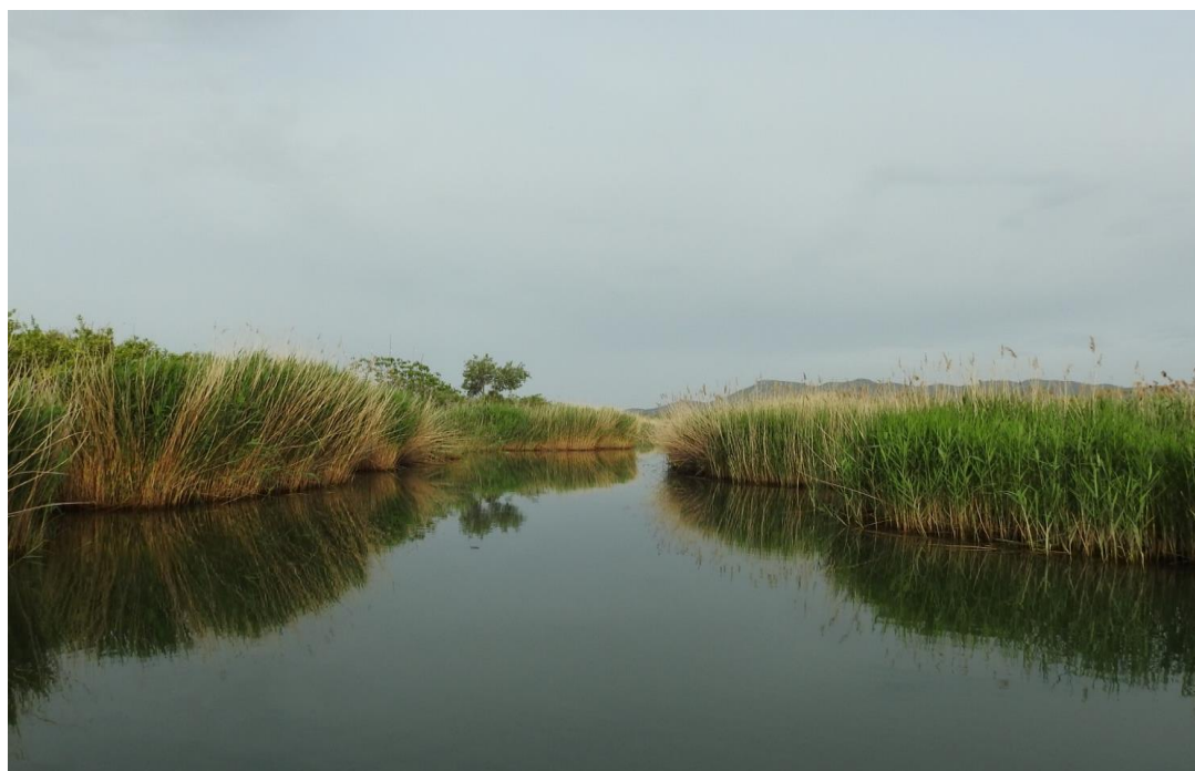
Fotografija 7. Područje monitoringa – rijeka Lisna