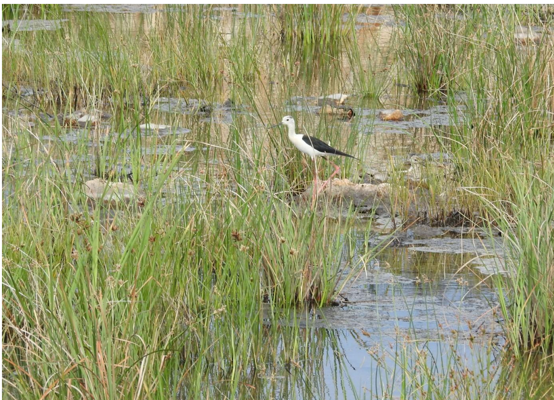
Fotografija 1. Odrasla i mlada vlastelica u luci Ploče

Fotografija na naslovnici: Vlastelica ( Himantopus himantopus ) - mlada (potrkušac) s područja monitoringa – lokalitet luka Ploče