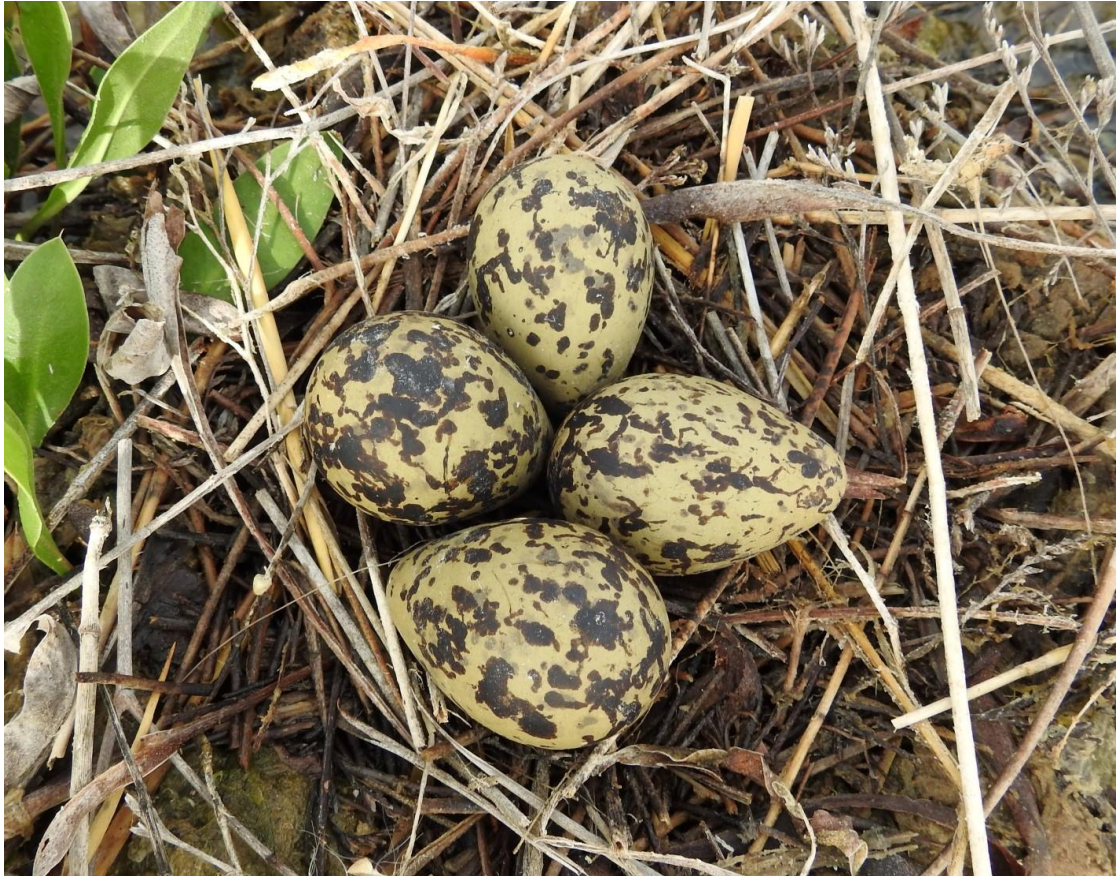
Fotografija 3. Gnijezdo sa jajima vlastelice

gnježdenja. Korišteni su kvalitetni dalekozor i durbin (Swarovski i durbin Swarovski AT 80 HD s okularom 20-60x).