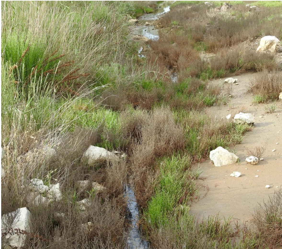
Fotografija 13. Dio monitoringa - mjesto gniježđenja - luka Ploče

je izumrla. Nepridržavanjem propisanih zaštitnih mjera u cijelosti, između ostalog, produljenjem radova u podmakloj sezoni gniježđenja (uznemiravanje ptica radom teške mehanizacije), uz već navedeno, izvođači monitoringa očekivali su ovakav učinak na gnijezdeću populaciju morskog kulika, a djelomično i vlastelice.