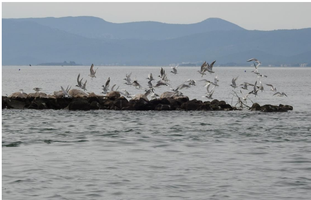
Fotografija 6. Jedan od lokaliteta monitoringa – na dijelu jezera Parila galebovi i dugokljune čigre

Swarovski AT 80 HD s okularom 20-60x). Povremeno je korištena i metodologija noćnog zvukovnog vaba.