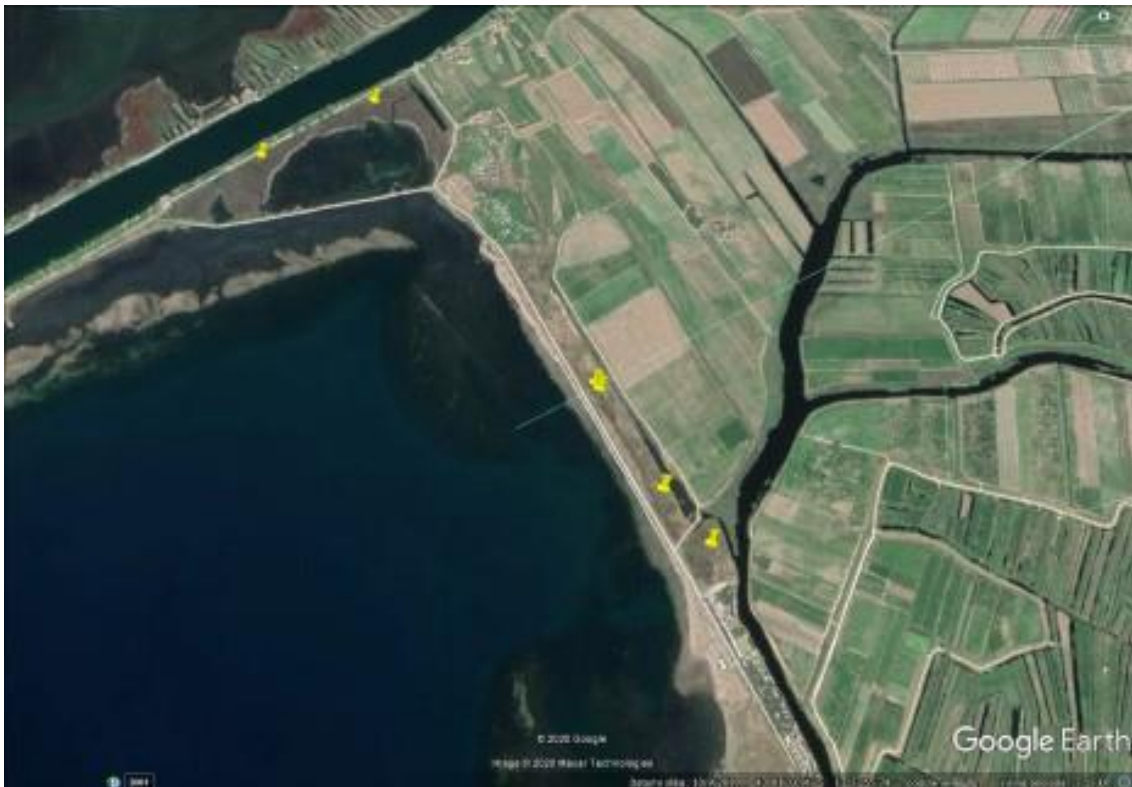
Fotografija 12. Gnijezda vlastelice na ušću Neretve